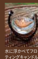
水に浮かべてフローティングキャンドル

キャンドルを灯すときは、灯芯を5mmくらいに切って火をつけます。キャンドルホルダーや平らな皿の上に置き、倒れたり、ミツロウが流れてもよいようにします。周囲に燃えやすい物を置かないでください。