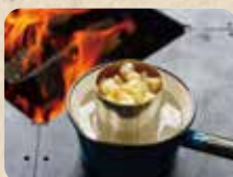
必ず湯せんして溶かします

をそのままナベに入れ湯せんします。 全て溶かして液体化させてください。 ミツロウが溶けるまで側を離れないでください。