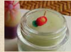
容器に流し込んで